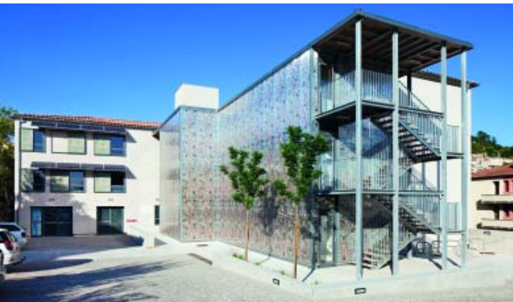
Cette ancienne gendarmerie a été réhabilitée en pépinière d'entreprises. L'habillage singulier de la coursive dote le bâtiment d'une identité facilement reconnaissable.